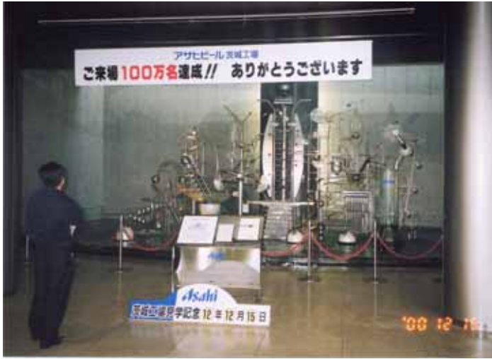
アサヒビール守谷工場「水のモニュメント」