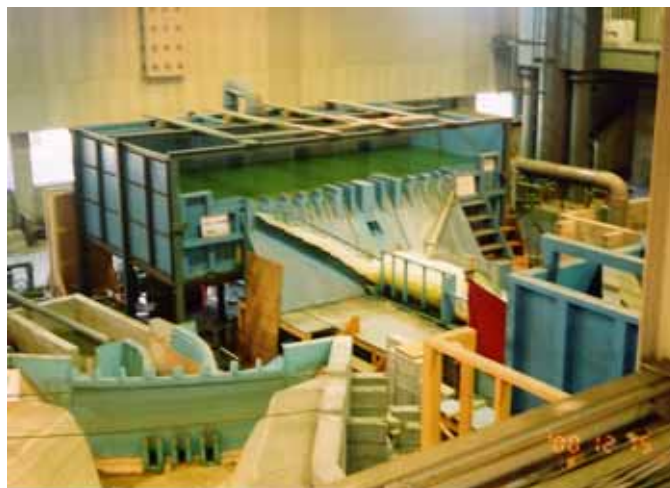
ダム構造実験施設 越流実験