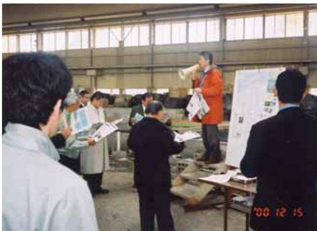
河川水理実験施設 島根県「斐伊川バイパス放水路施設」