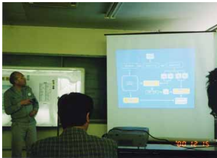
東京鉄骨橋梁 取手工場にて「スライドによる制作工程説明」