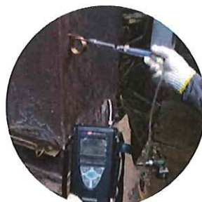
排ガスのO 2 濃度計測**