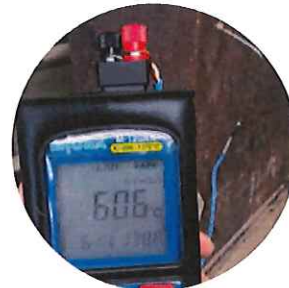
排ガス温度の計測**