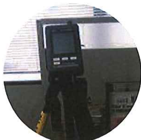
室内のCO 2 濃度計測*